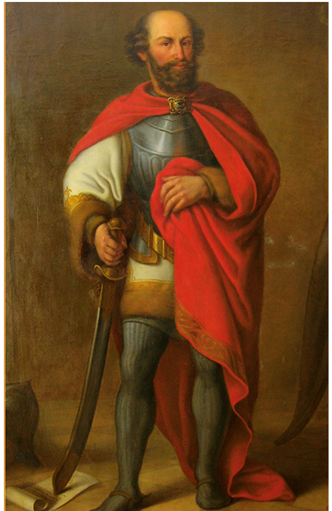
Jedna z podobizní Matúša Čáka. Jeho presný výzor je však neznámy.

Peter Čák si pri dvore počínal veľmi dobre, preto sa mu ušlo veľké vyznamenanie – kráľ ho vymenoval za palatína , najvyššieho úradníka v krajine, prvého hodnostára po kráľovi. Ak sa kráľ vybral za hranice kráľovstva, palatín ako jeho zástupca preberal vládu nad celou krajinou. Okrem toho sa Pe-