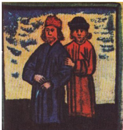
Zámožný Košičania si mohli dovoliť podobnú slávnostnú odev

a Peter zo Sečoviec – náhle prepadli ich vojenský sprievod, takže jeho vodcovia si ledva ratovali holý život. Víťazi sa opevnili na najvýznamnejšom východoslovenskom hrade Šariš a čakali na vojenské posily, ktoré mal vyslať Matúš. Čakanie bolo o to netrpezlivejšie, že k hradu, ako hlásili špehúni, sa blížili vojská Karola Róberta. Ešteže na poslednú chvíľu dorazil obrancom na pomoc vojvodca Demeter z rodu Kačivcov, ktorého poslal Matúš z Trenčína i s hufom vojakov. Kráľ Karol Róbert bral vec vážne. Len čo sa utáboril pod Šarišom, dal zvolať všetku východoslovenskú šľachtu s rozkazom, aby nastúpila do vojska pod jeho zástavy. Kto neprišiel, podľa kráľovského nariadenia ihneď stratil všetky majetky. Veľké a dobre vyzbrojené kráľovské vojsko sa za zvukov trúb a bubnov vrholo na múry Šarišského hradu, presvedčené, že takej presile obrancovia nedolajú. Ale prerátalo sa. Jedného rána, keď poslovia ohlásili, že na východ sa ženie 1700-členná armáda Matúša Trenčianskeho, ktorej velí šintavský vojvodca Aba Krásny, kráľ Karol Róbert sa roztriasol. Odtiahol radšej na Spiš a zavrel sa za múry mesta Levoča, kde začal organizovať pomoc pre Košice. Po veľkých manévroch, ktoré trvali takmer dva týždne a pri ktorých vojvodcovia hľadali najvýhodnejšie miesto na otvorený boj, sa 15. júna 1312 obe armády stretli neďaleko Košíc, pri obci