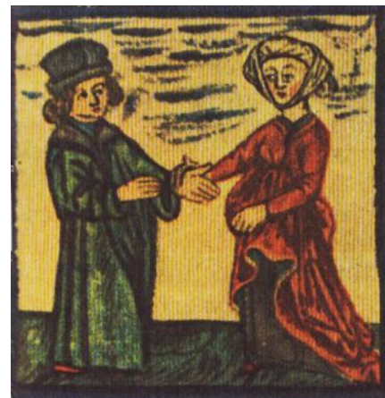
Mladí meštianski snúbenci v honosnom oblečení