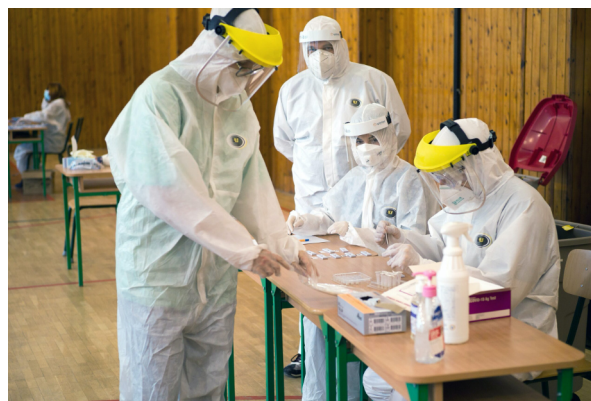
Obrázok je ilustračný

V našej mestskej časti sme sa tiež pripravili na celoplošné testovanie na COVID-19 tak ako bolo potrebné. Pán starosta sa zúčastňoval všetkých krízových štábov a stretnutí na ktorých boli podávané informácie ohľadne príprav priestorov, materiálu, personálu a organizácie tejto výnimočnej akcie. Za odborné miesto bol po konzultáciách s veliteľom OM vybraný Dom kultúry a do príprav priestorov sa zapojili všetci traja zamestnanci úradu MČ. Už týždeň pred termínom sme na odovzdávacom stretnutí s veliteľom odborného miesta (OM) mohli konštatovať, že sme pripravení. Už ostávalo iba zabezpečenie materiálu ale to bolo v réžii armády. Personálne sme boli pripravení ako sa vraví na 120%. Nakoniec bol vývoj taký, že sme zabezpečili kompletne i zdravotníkov hlavne z radov našich spoluobčanov. Podarilo sa nám zabezpečiť i stravu pre všetkých, ktorí cez víkend boli na mieste aj až 17 hodín nepretržite. Trocha štatistiky je namieste: v našom odbornom mieste sa za dva dni otestovalo takmer 600 občanov. Boli zachytení štyria pozitívni (z toho dvaja naši občania). A počas testovania sme nezaznamenali žiadny incident a ani akýkoľvek problém. Spolupráca so štátnou i mestskou políciou bola vynikajúca a občania si síce v sobotu vystáli radu ale v nedeľu to bolo podstatne voľnejšie. Na záver sme všetci spolu skonštatovali, že sme to zvládli a snád to už viac nebude treba opakovať.